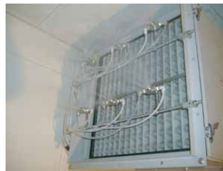
排気口ノズル設置部