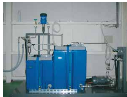
マイクロゲルスプレーユニット