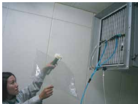
スプレーテスト臭気採取