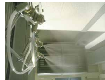
スプレー噴霧ミスト