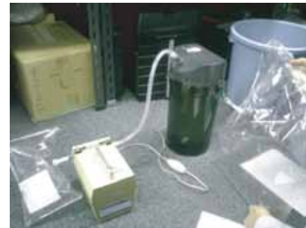
バブリングテスト風景