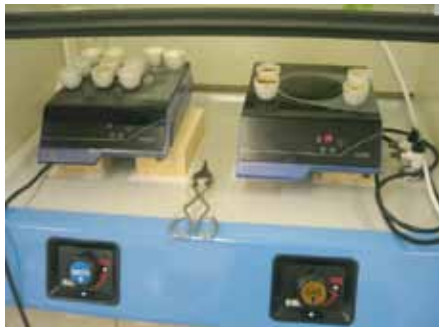
主な5種類全ての試料でテスト