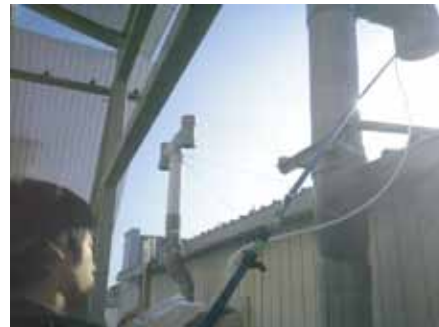
排気出口臭気採取