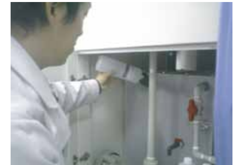
スクラバーへのマイクロゲル投入