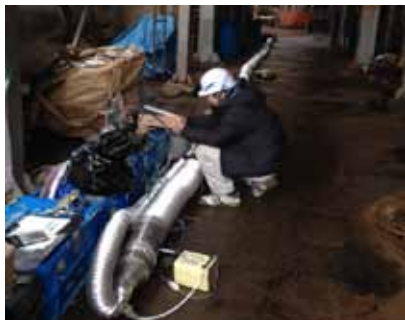
事前スプレーテストの様子