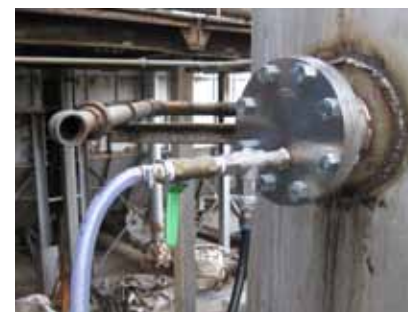
噴霧ノズル挿入部の様子