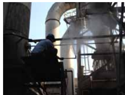
噴霧ノズルの様子