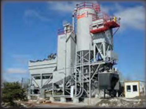
合材プラント製品の消臭