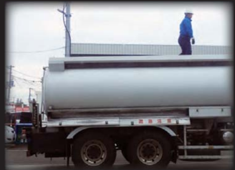
ローリー充填・吐出時の消臭