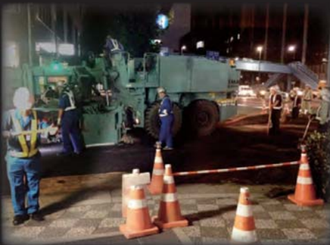
アスファルト舗装工事の消臭